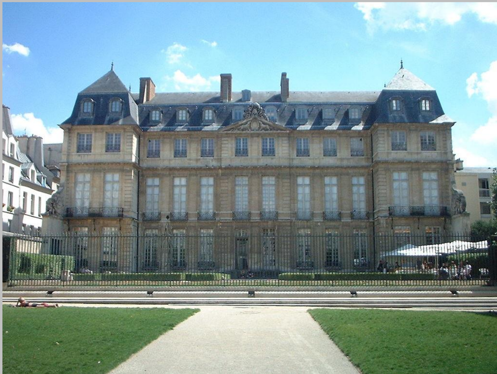
Musée Picasso im Hotel Salé, Paris