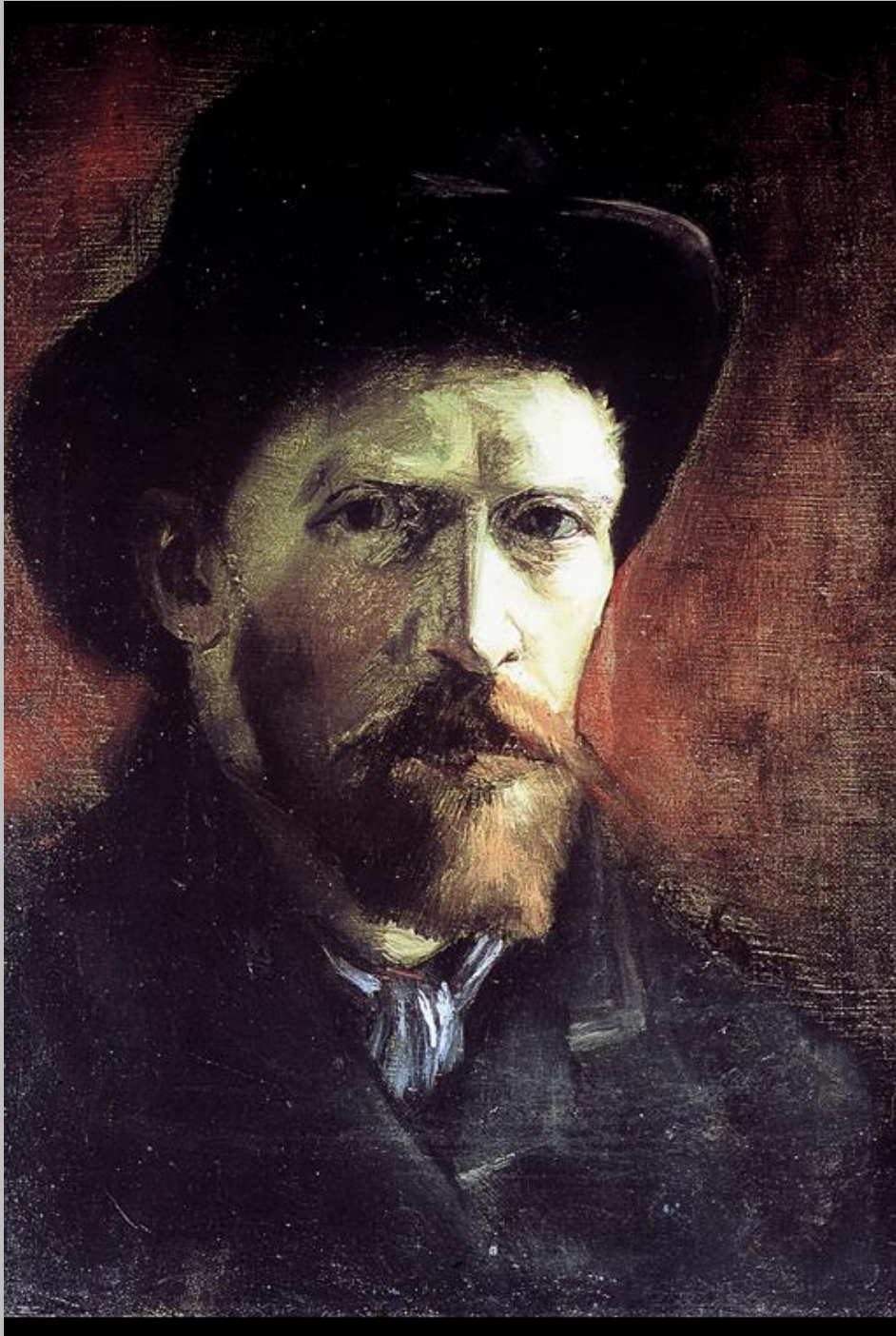
Vincent van Gogh, Selbstportrait mit Filzhut, 1886 Amsterdam, Van-Gogh-Museum